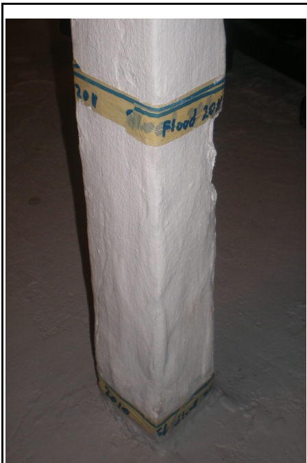
Søjlen hvor oversvømmelserne fra 2011 og 2010 er noteret med tape