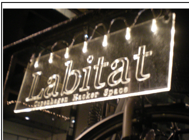
Skiltet som hænger på vej ned til Labitat på H. C. Ørstedes Vej 15 på Frederiksberg

Og så er det godt at man er et sted som Labitat.